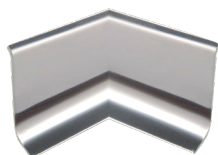
RI... 40/... raccordo interno