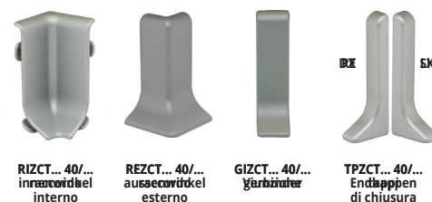
RIZCT... 40/... innarrodel interno REZCT... 40/... ausaerordtel esterno GIZCT... 40/... yarbznater TPZCT... 40/... Endtappen di chiusura