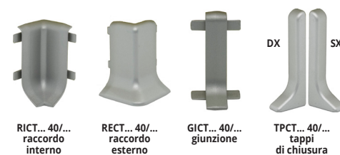
RICT... 40/... raccordo interno RECT... 40/... raccordo esterno GICT... 40/... giunzione TPCT... 40/... tappi di chiusura