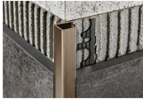
GEBÜRSTETES MESSING Thermoverpackung Stangenlänge 2,7 Lfm - VE 20 Stk. - 54 Lfm