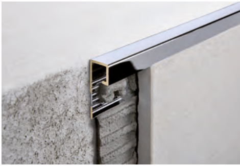
MESSING VERCHROMT Thermoverpackung Stangenlänge 2,7 Lfm - VE 20 Stk. - 54 Lfm