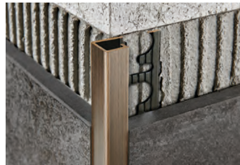
LAITON BROSSÉ thermo packed longueur b. 2,7 ML - cond. 20 Pcs - 54 ML