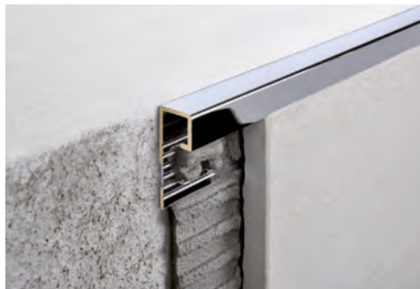
LAITON CHROMÉ thermo packed longueur b. 2,7 ML - cond. 20 Pcs - 54 ML