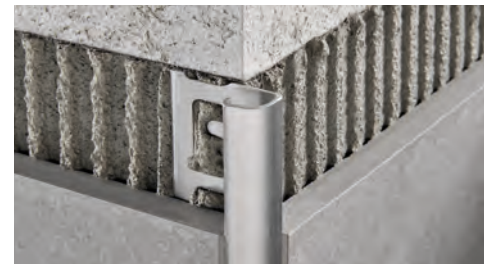
EDELSTAHL AISI 304/1.4301-V2A SATINIERT mit Schutzfolie Stangenlänge 2,7 Lfm - VE 20 Stk. - 54 Lfm (H 4,5 mm - 108 Lfm) - 10/10 mm