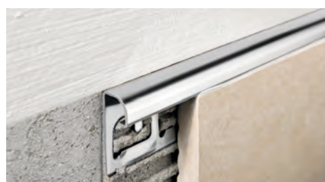
ACCIAIO INOX AISI 304/1.4301-V2A LUCIDO con pellicola protettiva lunghezza barre 2,7 ml - conf. 20 PZ - 54 ml (H 4,5 mm - 108 ml) - 10/10 mm