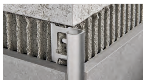
ACCIAIO INOX AISI 304/1.4301-V2A SATINATO con pellicola protettiva lunghezza barre 2,7 ml - conf. 20 PZ - 54 ml (H 4,5 mm - 108 ml) - 10/10 mm