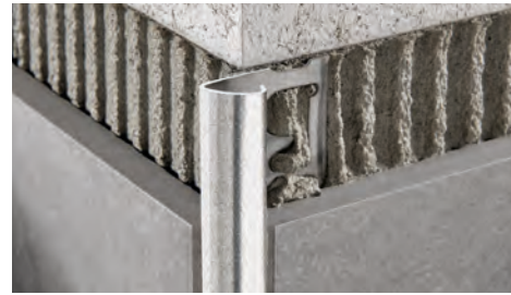
ACIER INOX AISI 304/1.4301-V2A SATINÉ avec film de protection longueur b. 2,7 ML - cond. 20 Pcs - 54 ML - 10/10 mm

ADAPTÉ AU CONTACT AVEC PRODUITS ALIMENTAIRES