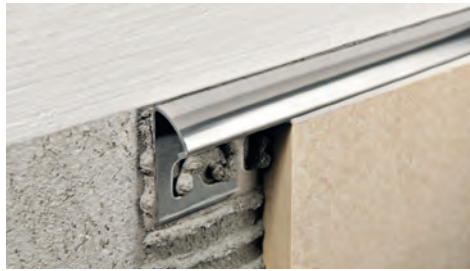
ACIER INOX AISI 304/1.4301-V2A POLI avec film de protection longueur b. 2,7 ML - cond. 20 Pcs - 54 ML - 10/10 mm

PROJOLLY facilite la pose en éliminant le jolly fragile des céramiques. Il est utilisé pour les angles externes des carreaux, pour la finition des revêtements, pour les estrades, les marches, les baignoires, etc. Il garantit un travail soigné et impeccable du point de vue esthétique. Il renforce le bord des carreaux en évitant les ébréchantures et les ruptures grâce à sa finition arrondie. Requis par les nouvelles normes européennes pour la sécurité et la prévention des accidents dans les lieux publics et les maisons particulières. Disponible la PROJOLLY MIRROR LINE polie à la main pour créer une finition super brillante, conçus pour répondre aux exigences et demandes modernes/high tech avec des finitions esthétiques et décoratives très brillantes. Des capsules et des raccords à trois axes pour les angles internes et externes sont disponibles. Son utilisation est conseillée avec des baguettes PROLISTEL en acier inox poli ou satiné.