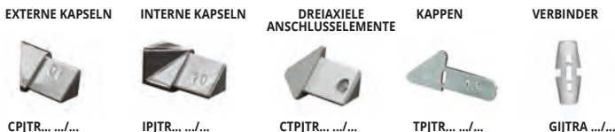
CPJTR... .../... IPJTR... .../... CTPJTR... .../... TPJTR... .../... GJTRTA .../...

ART. NUR IN GANZEN VERPACKUNGSEINHEITEN ERHÄLTlich