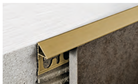
PJTR... 10 scala 1:1