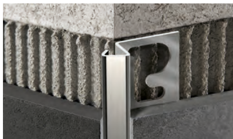
ПОЛИРОВАННАЯ НЕРЖ. СТАЛЬ AISI 304/1.4301-V2A с защитной пленкой - длина бруска 2,7 Лин.М - упак. 20 шт. - 54 Лин.М - 10/10 мм

НЕРЖАВЕЮЩАЯ СТАЛЬ AISI 304/1.4301-V2A ПОЛИРОВАННАЯ И САТИНИРОВАННАЯ