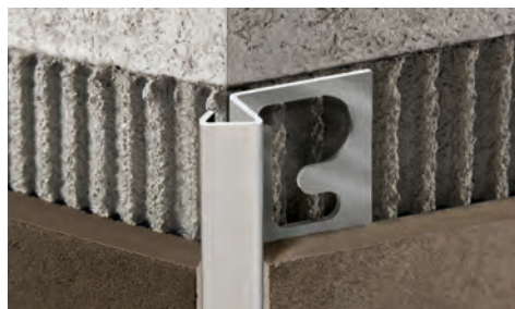
САТИНИРОВАННАЯ НЕРЖ. СТАЛЬ AISI 304/1.4301-V2A с защитной пленкой - длина бруска 2,7 Лин.М - упак. 20 шт. - 54 Лин.М - 10/10 мм

ACS - Сатинированная нерж. сталь AISI 304/1.4301-V2A