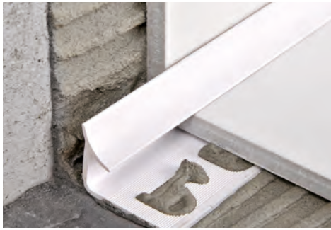
BEISPIEL UND TECHNISCHE ANLEITUNG FÜR DIE VERLEGUNG

UNGIFTIGES FARBIGES STOSSFESTES VINYLHARZ