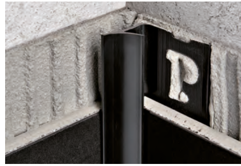
EJEMPLOS Y INSTRUCCIONES TECNICAS DE COLOCACIÓN