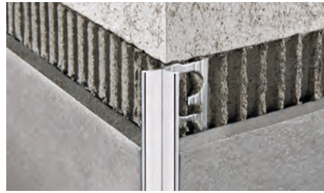
ALUMINIUM GLÄNZEND (Chrom - Titan) Thermoverpackung Stangenlänge 2,7 Lfm - VE 40 Stk. - 108 Lfm