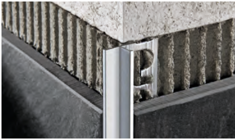
ALUMINIUM ELOXIERT (Silber - Titan) Thermoverpackung Stangenlänge 2,7 Lfm - VE 40 Stk. - 108 Lfm