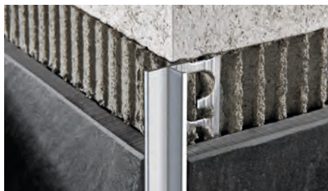
АНОДИРОВАННЫЙ АЛЮМИНИЙ (серебро - титан) в термоупаковке длина бруска 2,7 Лин.М - упак. 40 шт. - 108 Лин.М