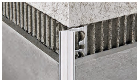
АЛЮМИНИЙ ПОЛИРОВАННЫЙ (хром - титан) в термоупаковке длина бруска 2,7 Лин.М - упак. 40 шт. - 108 Лин.М