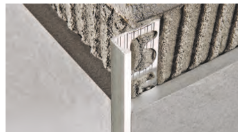
ALUMINIO CEPILLADO (plata, titanio, negro, cobre) termo empaquetado Unidades de 2,7 M de largo - Paq. de 40 UD - 108 M