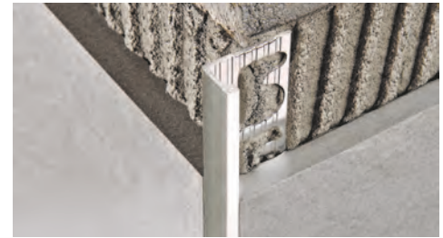
ALUMINIUM BROSSÉ (argent, titane, noir, cuivre) thermo packed - longueur b. 2,7 ML - cond. 40 Pces - 108 ML