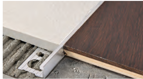
ALUMINIUM BRILLANTÉ (chrome, titane, noir, or et cuivre) thermo packed - longueur b. 2,7 ML - cond. 40 Pces - 108 ML