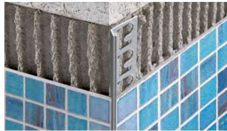
ACIER INOX AISI 304/1.4301-V2A POLI avec film de protection longueur b. 2,7 ML - cond. 40 Pces - 108 ML

PROKERLAM LINE est un produit étudié et conçu sous forme de profil mince quasi invisible pour réduire au minimum la séparation du matériau, pour la pose des céramiques de faible épaisseur et pour la mosaïque. La denture créée à l'extrémité du profil permet à la colle/adhésif de s'ancrer parfaitement au profil. Protège l'angle en créant un effet technique-chromatique de grande valeur esthétique.