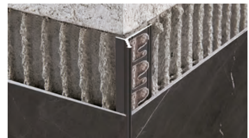
ALUMINIUM LAQUÉ thermo packed longueur b. 2,7 ML - cond. 40 Pces - 108 ML