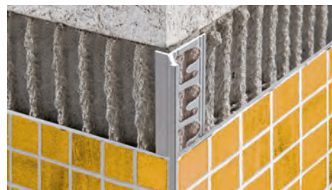
ALUMINIUM ANODISÉ thermo packed longueur b. 2,7 ML - cond. 40 Pces - 108 ML

PROKERLAM LINE est un produit étudié et conçu sous forme de profil mince quasi invisible pour réduire au minimum la séparation du matériau, pour la pose des céramiques de faible épaisseur et pour la mosaïque. La denture créée à l'extrémité du profil permet à la colle/adhésif de s'ancrer parfaitement au profil. Protège l'angle en créant un effet technique-chromatique de grande valeur esthétique.