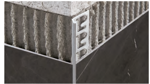
ACIER INOX AISI 304/1.4301-V2A SATINÉ longueur b. 2,7 ML - cond. 40 Pces - 108 ML