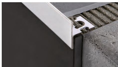
ACIER INOX AISI 304/1.4301-V2A POLI avec film de protection longueur b. 2,7 ML - cond. 15 Pces - 40,5 ML