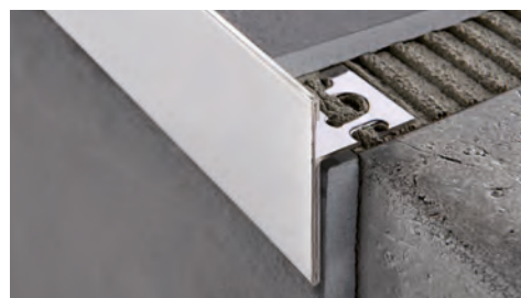
ACIER INOX AISI 304/1.4301-V2A SATINÉ avec film de protection longueur b. 2,7 ML - cond. 15 Pces - 40,5 ML