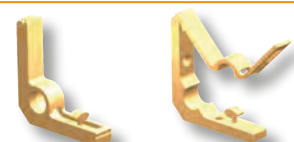
SCOL 11 SCOL 13

Zu berücksichtigen und nach dem artikelcode der buchstabe C hinzuzufügen. Z.B.: SCOL 11C.