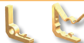
SCOL 11 SCOL 13

* = Production sur demande avec quantité minimale de 200 pcs. Délai de production 4/5 semaines. Prix à établir