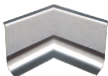
RI... 40/... Conexion interior