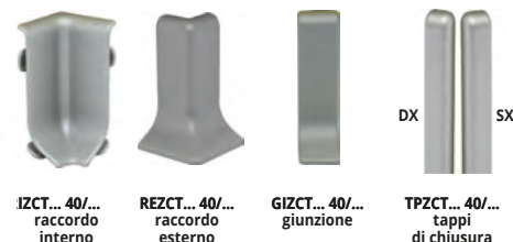
IZCT... 40/... raccordo interno REZCT... 40/... raccordo esterno GIZCT... 40/... giunzione TPZCT... 40/... tappi di chiusura

GIUNZIONE - COPRITAGLIO PLASTICA VERN. EFFETTO ANODIZZ. ARGENTO, BRILL. TITANIO