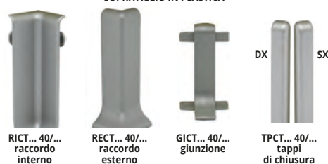
RICT... 40/... raccordo interno RECT... 40/... raccordo esterno GICT... 40/... giunzione TPCT... 40/... tappi di chiusura

* * * = Articolo a richiesta minimo d'ordine 80 Pz. Tempi di produzione 4/5 settimane. Prezzo da concordare