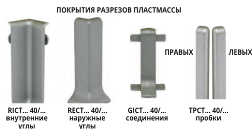
RICT... 40/... внутренние углы RECT... 40/... наружные углы GICT... 40/... соединения TRCT... 40/... пробки

Выбрать желаемую упаковку. Например: TRCTAA 40/2 (упак. 4шт.: 2 правых + 2 левых) - TRCTAA 40/5 (упак. 10шт.: 5 правых + 5 левых)