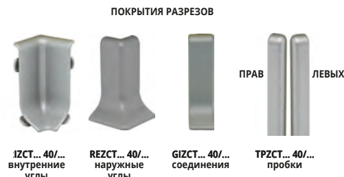
IZCT... 40/... внутренние углы REZCT... 40/... наружные углы GIZCT... 40/... соединения TRPCT... 40/... пробки

СОЕДИНЕНИЯ - ПОКРЫТИЯ РАЗРЕЗОВ ОКРАШ. ПЛАСТИК АНОД. СЕРЕБРО, БЛЕСТЯЩИЙ ТИТАН