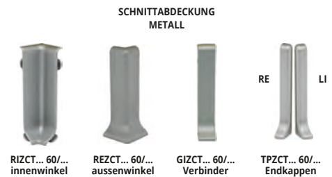
RIZCT... 60/... innenwinkel REZCT... 60/... aussenwinkel GIZCT... 60/... Verbinder TPZCT... 60/... Endkappen

Auf Anfrage sind auch verfügbar bündig vorgeklebte Innen- und AUSSENwinkel in die Oberflächendekors: 01 - 010 - AA - BT - BS - RS - TS. Lieferzeit und Kosten zu vereinbaren