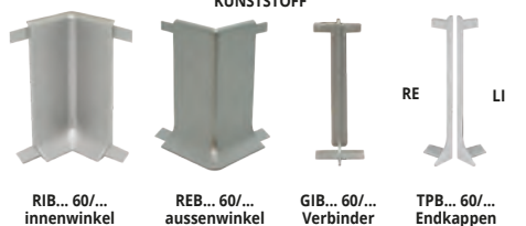
RIB... 60/... innenwinkel REB... 60/... aussenwinkel GIB... 60/... Verbinder TPB... 60/... Endkappen

*** = Produktion Auf anfrage mit Mindestmenge von 80 Stk. Produktionszeit 4/5 Wochen, Preis zu vereinbaren