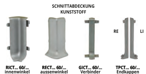
RICT... 60/... innenwinkel RECT... 60/... aussenwinkel GICT... 60/... Verbinder TPCT... 60/... Endkappen