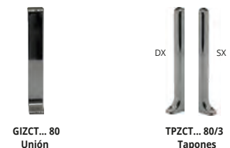
GIZCT... 80 Unión