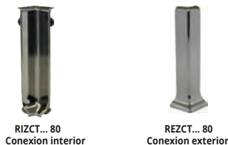
RIZCT... 80 Conexión interior