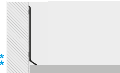
BEISPIEL UND TECHNISCHE ANLEITUNG FÜR DIE VERLEGUNG

VERWENDEN SIE PROBAND FIX UM DAS PROFIL AN DER WAND ZU BEFESTIGEN