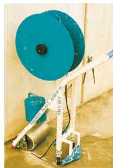
DÉBUT DE POSE