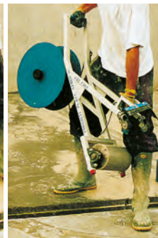
LÉGÈRE À TRANSPORTER