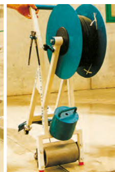
ВРАЩАЮЩИЕСЯ ПОДНИМАЮЩИЕСЯ НОЖКИ