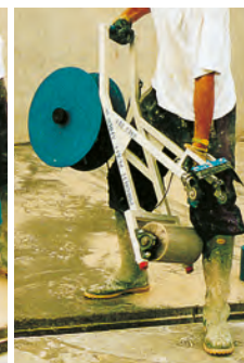
ЛЕГКОВЕС ДЛЯ ПОДВИЖНОСТИ