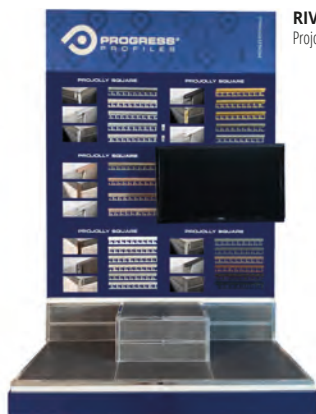
RIV 2: Projolly square;