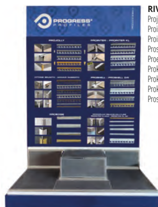
RIV 3: Projolly, Printer, Printer kl, Proshell, Proedge, Prokerlam square, Prokerlam jolly, Prokerlam line, Prostair kl;