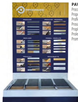
PAV 2: Procover, Propress, Profloor, Prosol, Proplate, Prolevall, Promoque;