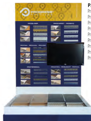
PAV 1: Proslider, Procarpet, Proskid, Profinal, Procanal, Projoint, Proterminal, Prolevelgal, Proelegant;