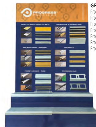
GR2: Prostyle grip, Prostyle 2610, Proend ins, Proend grip, Prowalk, Prostair led, Proside walk;