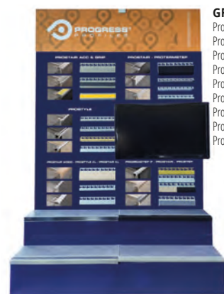
GR1: Prostair acc Prostair kl, Prostair grip, Prostair wood, Protermstep, Prostyle, Prostyle kl, Probrastep, Prostep;