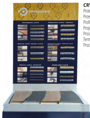
CRV: Proterminal curve, Proelegant curve, Profinal curve, Projolly curve, Proslider curve, Terminal curve, Procover;