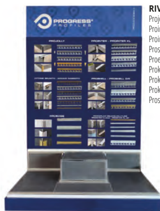
RIV 3: Projolly, Printer, Printer kl, Proshell, Proedge, Prokerlam square, Prokerlam jolly, Prokerlam line, Prostair kl;