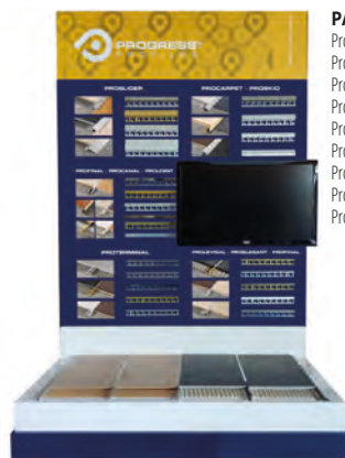
PAV 1: Proslider, Procarpet, Proskid, Profinal, Procanal, Projoint, Proterminal, Prolevelig, Proelegant;