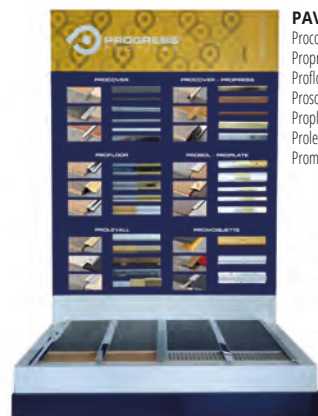
PAV 2: Procover, Propress, Profloor, Prosol, Proplate, Prolevel, Promoque;