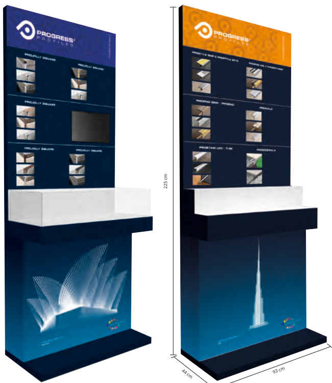
ESPOSITORE MODULARE CON VIDEO

Il SISTEMA ESPOSITIVO MODULARE A PANNELLI INTERCAMBIABILI è costituito da una base in metallo che funge da supporto, di altezza 225 cm, larghezza 93 cm e profondità 44 cm. A questa struttura possono essere facilmente fissati i pannelli espositivi dove sono presenti le immagini di esempi di posa dei profili e i relativi campioni di prodotti. Sulla parte centrale è predisposta una mensola di appoggio dove è presente un esempio di ambientazione (spaccato espositivo) dei modelli di profili più diffusi presenti sui pannelli sopra esposti. Grazie alla facilità di montaggio ed alle dimensioni di ingombro ridotte, il sistema espositivo può essere facilmente adattato a qualunque ambiente, show room e punto vendita. Grazie alla modularità dei pannelli espositivi, il sistema può essere scelto sulla base dei prodotti che si intendono promuovere maggiormente. Il sistema è inoltre facilmente rinnovabile nel tempo e adattabile agli aggiornamenti di finitura e inserimento di nuovi prodotti.