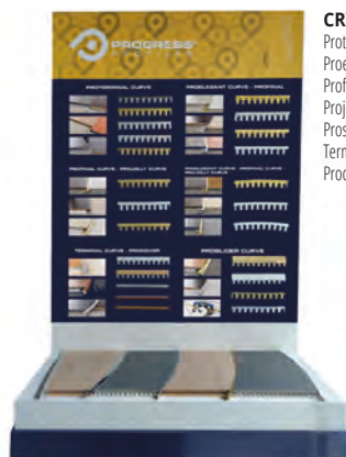
CRV: Proterminal curve, Proelegant curve, Profinal curve, Projolly curve, Proslider curve, Terminal curve, Procover;