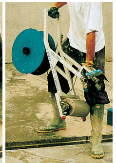
LEICHT ZU TRANSPORTIEREN