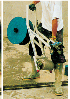
LÉGÈRE À TRANSPORTER