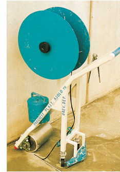
DÉBUT DE POSE