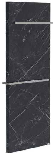
Progress Profiles | Proheater.

Il pannello portante Profoil Panel , in polistirene estruso ad alta densità (33 kg/mc), ha una elevata capacità isolante ed è rivestito su entrambi i lati da una membrana impermeabile all'acqua e al vapore che conferisce al pannello una elevata rigidità.