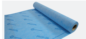
PROFOIL PFLO 0405