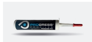
PROBAND FIX PRBFXB