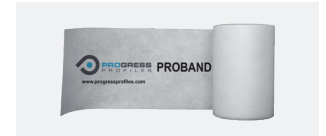
PROBAND 150 PRBPE 1507