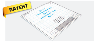
PROSHOWER PANEL LINEAR PSHPAN