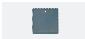
ЗУБЧАТЫЙ ШПАТЕЛЬ PRSPD 10