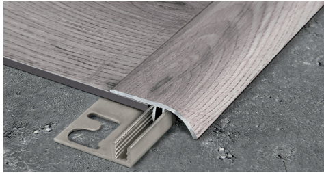
ZERO CURVE (Pag. 244)