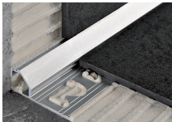
PROSHELL D ALL (Pag. 159)