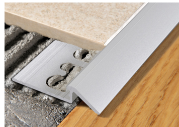
PROSLIDER KL ALL (Pag. 86)