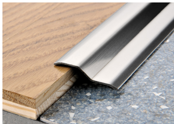
PROFLOOR 24 (Pag. 85)