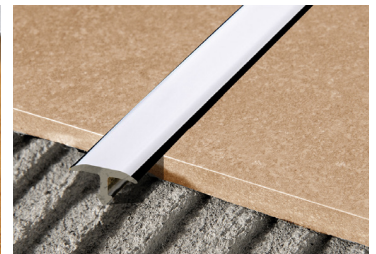
PROCOVER 1045 ALL (Pag. 86)