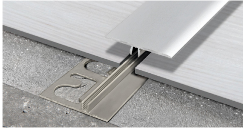
SOL 30P (Pag. 244)