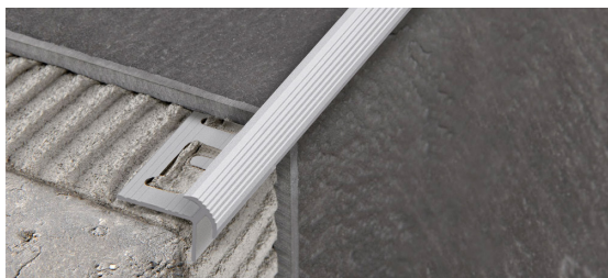
PROSTYLE KL 10 (Pag. 161)