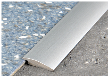
PROLINOLEUM (Pag. 85)