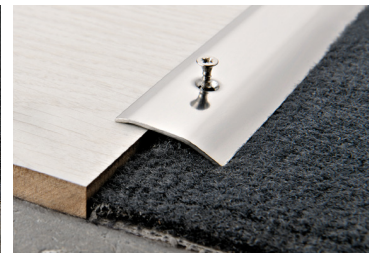
PROLEVALL 305 (Pag. 80)