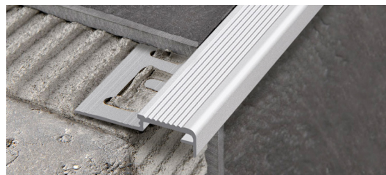
PROSTAIR KL 20 (Pag. 161)