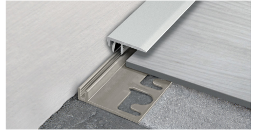
TERMINAL PIN (Pag. 244)