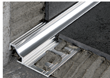
PROSHELL R ALL (Pag. 159)