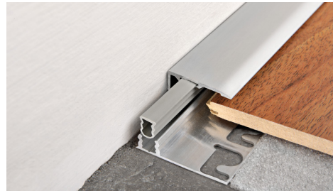
TOP ALU. + INSERT PIN + BASE 40 ALU. COUPÉE/PERFORÉE (6 finitions alu. anod. 3 sur demande) thermo packed long. b. 2,7 ML - cond. 20 Pces - 54 ML (PIN 11, 15, 17 - 40,5 ml) (PIN 19 - 27 ml)