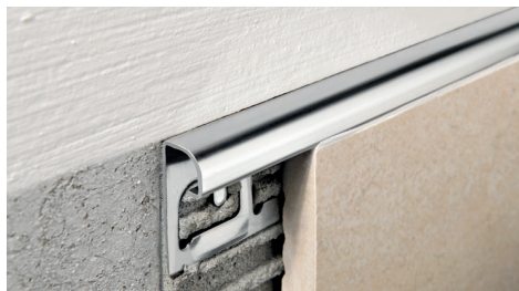
ACCIAIO INOX AISI 304/1.4301-V2A LUCIDO con pellicola protettiva lungh. barre 2,7 ml - conf. 20 PZ - 54 ml (H 4,5 mm - 108 ml) - 10/10 mm