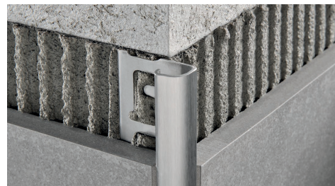
ACCIAIO INOX AISI 304/1.4301-V2A SATINATO con pellicola protettiva lungh. barre 2,7 ml - conf. 20 PZ - 54 ml (H 4,5 mm - 108 ml) - 10/10 mm