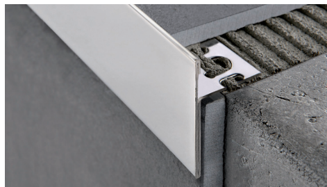
ACCIAIO INOX AISI 304/1.4301-V2A SATINATO lungh. barre 2,7 ml - conf. 15 PZ - 40,5 ml