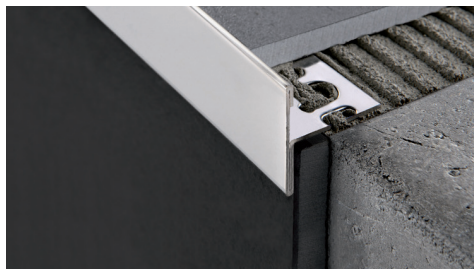
ACCIAIO INOX AISI 304/1.4301-V2A LUCIDO con pellicola protettiva lungh. barre 2,7 ml - conf. 15 PZ - 40,5 ml

ACCIAIO INOX AISI 304/1.4301-V2A LUCIDO E SATINATO