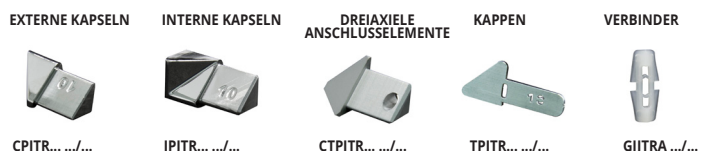
CPJTR... /... IPJTR... /... CTPJTR... /... TPJTR... /... GIJTRA .../...

ART. NUR IN GANZEN VERPACKUNGSEINHEITEN ERHÄLTLICH