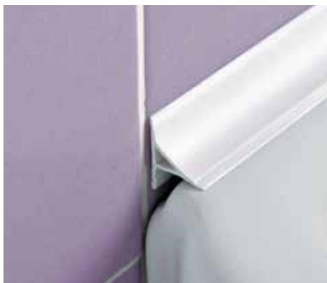
CAMPI DI APPLICAZIONE

PROBATH FLEX è un profilo a forma di sguscia concava in resina vinilica atossica flessibile di colore bianco, con superficie a vista di 16 x 16 e 20 x 20 mm. Il profilo, munito di una flangia di ancoraggio a forma di freccia, è particolarmente idoneo visto il suo elevato raggio di curvatura, a garantire la pulizia e quindi l'igiene in prossimità dei raccordi tra rivestimento e lavabo, vasche, vasche idromassaggio e piatti doccia. Il profilo resiste a funghi, batteri e ai raggi UV. La sua particolare sezione e la disponibilità, dei pezzi speciali quali angolo esterno, angolo interno, giunzioni e tappi di chiusura, rendono PROBATH FLEX un profilo molto ricercato e facile da applicare.