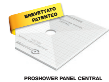
PROSHOWER PANEL CENTRAL